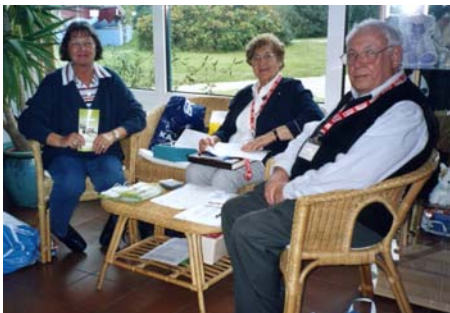
LKK-akceptejo okaze de la 49-a jarkunveno

La 14-an de oktobro 2005, la trajno veturis sur tiu, en 1927 konstruita fervoja digo, por atingi la plej nordan, germanan insulon Sylt. Tie, ĉe la rando de la belega, tipe frisa vilaĝo Rantum, la Germana Fervojista Esperanto-Asocio okazigis la