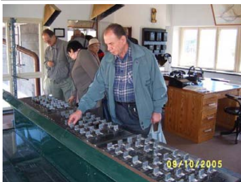
Praktika priservo de la unua aparato de la elektrodinamika stacia sekuriga aranĝaĵo, funkciinta en Přerov.

Allogaj ankaŭ estis ambaŭ fakaj ekskursoj. Dum la unua, sabate, antaŭtagmeze oni vizitis historian fervojon kaj fervojistan muzeon en Zubrnice en České Středohoří. Oni povis praktike elprovi iujn aranĝaĵojn