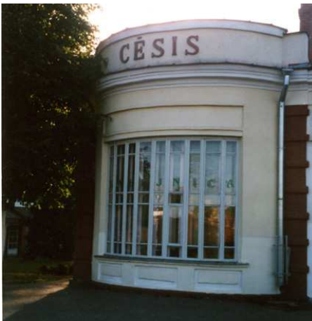
Stacidomo de Cēsis (malantaŭ la fenestro troviĝis kafejo)

Bedaŭrinde ne eblis veturi per trajno de la LDZ, sed certe valorus veturi tra la bela lando.