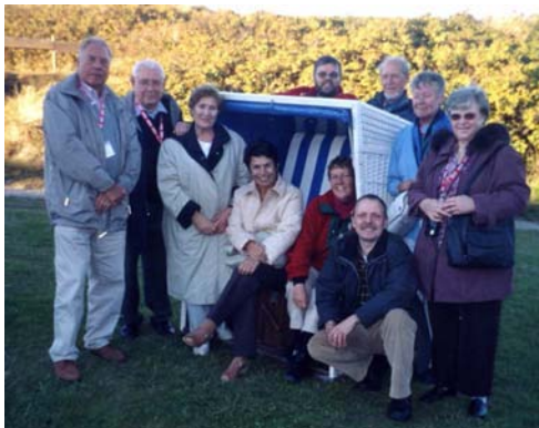
LKK kun eksterlandaj gastoj