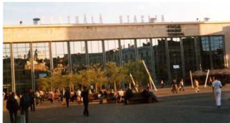
Stacidomo de Rigo /Riga (stratflanko)

En Latvio, mi vizitis dum la postkongresa ekskurso, du staciojn, en Rigo kaj en la urbeto Cēsis. En Rigo mi estis, dimancon vespere, kiam alvenis du trajnoj kun amaso da pasaĝeroj, vere amasoj. Supozeble, ili venis el la semajnfina restado sur la kamparo aŭ en feriaj domoj tra la lando. La ŝildo sur la moderna konstruaĵo, kiun oni vidas flanke de la urbo, montras la signifon en tri lingvoj: latva, rusa kaj angla. La horarafiŝoj estas en du lingvoj: latva kaj rusa, en Cēsis nur en la latva. La interno de la ĉefa stacidomo entenas multajn vendejojn, inter ili ankaŭ biletvendejojn. La biletoj venas el komputiloj, similaj al tiuj en Litovio. La stacio havas subpasejon kaj la trakaro estas elektrizita. La stacio Cēsis havas du trakojn por pasaĝeroj kaj pliaj por la trapaso sen halto kaj la vartrafiko. Je 19.30 h tie oni ŝarĝis 4-aksajn varvagonojn. Laŭ la horaro veturas sur tiu dutraka linio 5 trajnoj en ambaŭ direktoj : al Rigo kaj al Valmiera (norden). La trakoj ne estis