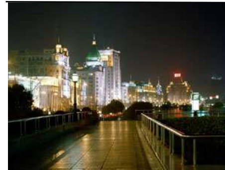
Sanhajo en nokto

Koboldo trafis la verkaĵon...kaj pardonon petas