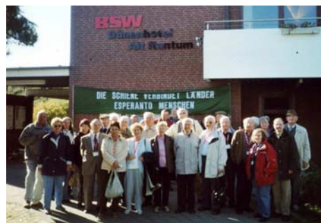
Partoprenantoj antaŭ la kongresejo

modernajn partojn en la ĉefloko de la insulo, Westerland, kaj ankaŭ aliloke. Ni preterpasis tiujn, per amofiloj briditajn dunojn kaj ankaŭ migrodunojn. Ĉar Sylt estas insulo, ne mankis mallonga ŝipveturo. La klarigoj, survoje, estis bedaŭrinde germanaj, ĉar la ekskurso okazis per publikaj aŭtobusoj.