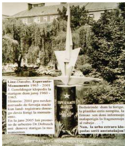
Pergamena dokumento enbetonita en la monumenta soklo.

En aprilo 2001, oni devis forigi la Esperanto-Monumenton apud la fervoja stacio Linz, pro novkonstruaĵo de la landa oficeja centro. Nun, en la jaro 2005, post novkonstruado de la stacio