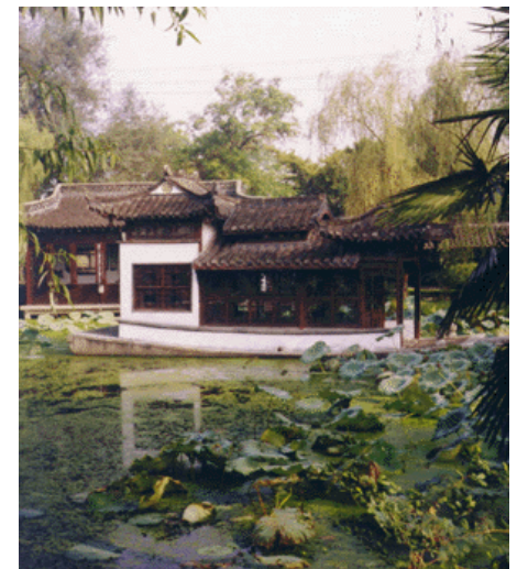
Pagodoj ĉe okcidenta lago

Pli da detaloj pri tiu ekskurso, vi legos en la sekvontaj paĝoj.