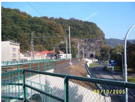
Fervoja stacio Děčín.

vicprezidanto de la teknika komisiono de FISAIC, oni trarigardis riĉan kolekton da objektoj de la sekurigaj kaj interkomunikadaj teknikoj uzataj en Ĉeĥio. Unu el la plej valoraj ekspoziciaĵoj estas la unua en la mondo aparato de la elektrodinamika stacia sekuriga aranĝaĵo, instalita en la moravia fervojstacio Přerov en la jaro 1894, kiun oni eĉ povis provi praktike priservi.