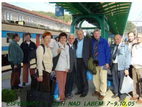
Parto de la partoprenantoj atendantaj trajnon en la fervoja stacio Děčín.

Allogaj ankaŭ estis ambaŭ fakaj ekskursoj. Dum la unua, sabate, antaŭtagmeze oni vizitis historian fervojon kaj fervojistan muzeon en Zubrnice en České Středohoří. Oni povis praktike elprovi iujn aranĝaĵojn